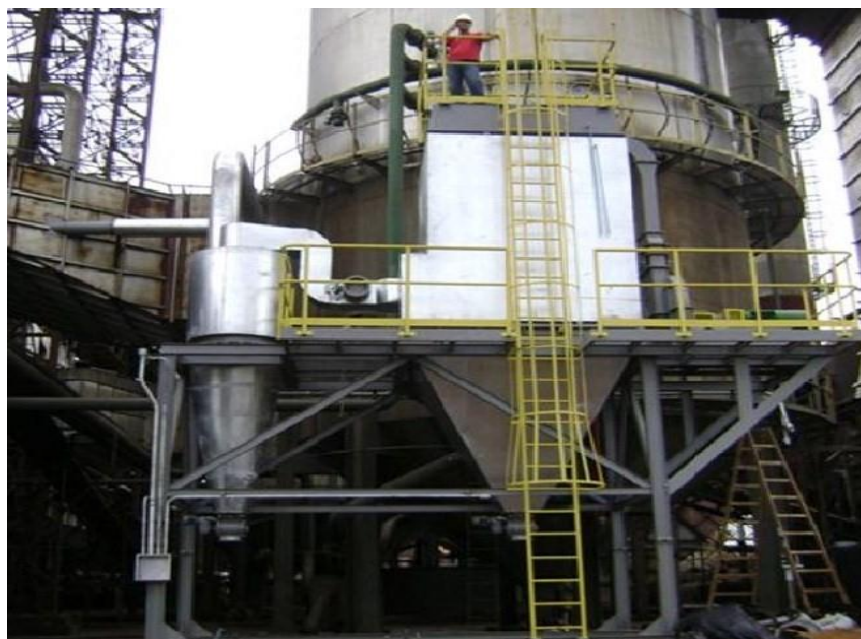
Figura 1. Instalação piloto típica de tratamento de gases

Na figura 1 apresenta-se a imagem da instalação piloto, com a respectiva disposição dos equipamentos utilizados em uma montagem típica para sistemas de tratamento de gases por via seca.