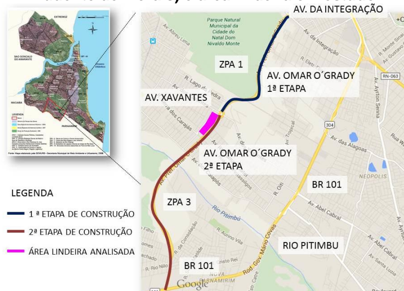
Figura 2. Etapas de execução da Av. Omar O'Grady (prolongamento da Av. Prudente de Moraes) e área lindeira em estudo.