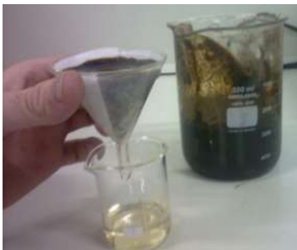
Figura 4 - Filtragem simples da mistura