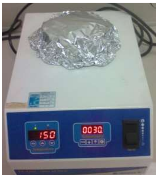
Figura 5 - Bloco Digestor