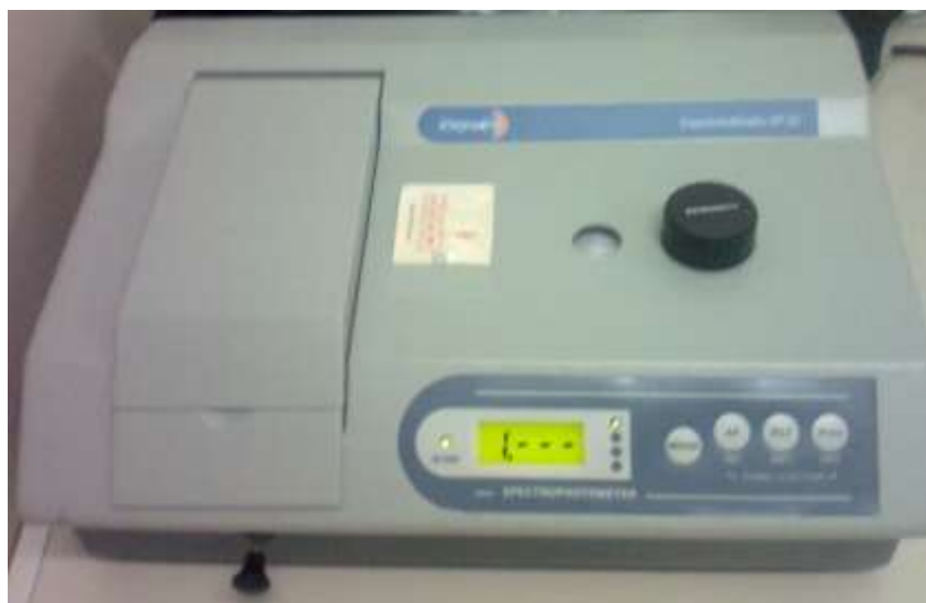
Figura 6 - Espectrofotômetro