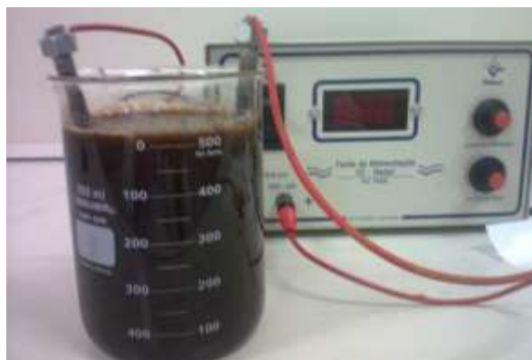
Figura 1 - Estrutura para realizar Eletrofloculação

Para iniciar o experimento, foi realizado a montagem do equipamento como mostrado na figura 1, onde utilizou-se de um béquer com capacidade de 1 litro, dois tubos cilíndricos, cabos banana e um transformador de energia.